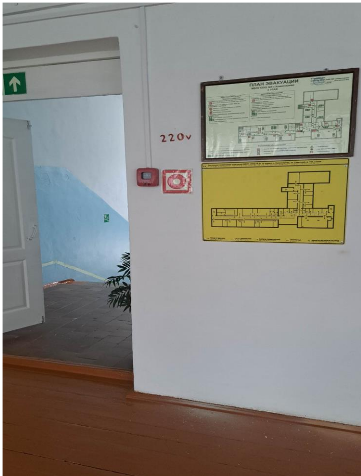
фойе 2-го этажа